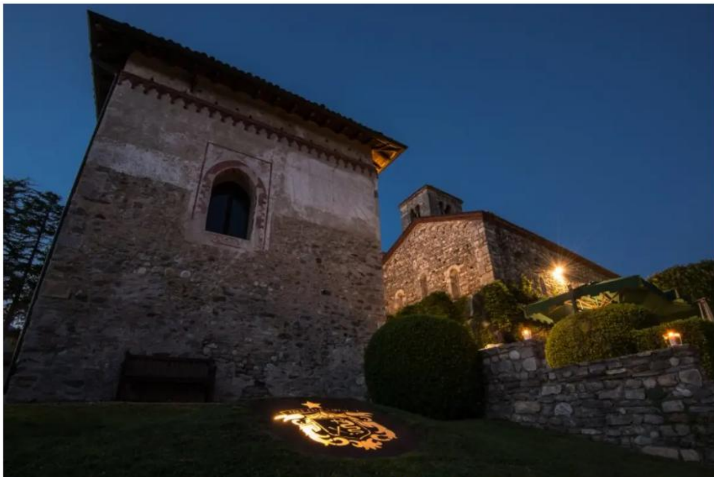
La suggestiva location del Golf Club Varese a Luvinate

Il Golf Club Varese , fondato nel 1897 e situato a Luvinate dal 1934, è uno dei circoli storici più affascinanti d'Italia. Il percorso a 18 buche, tecnico e ondulato, offre panorami mozzafiato sul Monte Rosa , sui Laghi Maggiore, di Varese e di Monate , oltre che sul Sacro Monte e sul Campo dei Fiori . Il tracciato, migliorato negli anni da Baldovino Dassù, Giulio Cavalsani e Graham Cooke , è noto per buche dog-leg, dislivelli e green di piccole dimensioni .