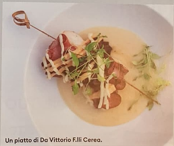
Un piatto di Da Vittorio F.lli Cerea.