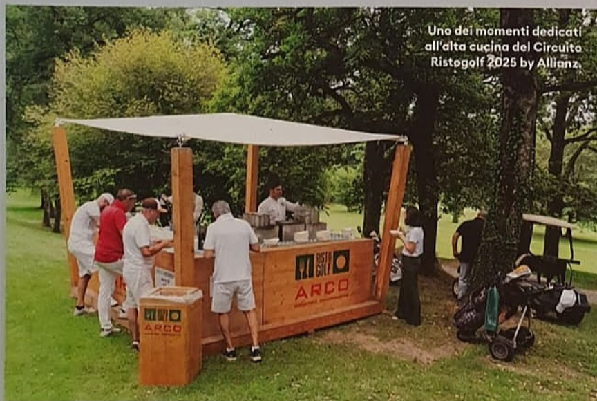
Uno dei momenti dedicati all'alta cucina del Circuito Ristogolf 2025 by Allianz.

In Romagna, l'evento conclusivo del Circuito Ristogolf 2025 by