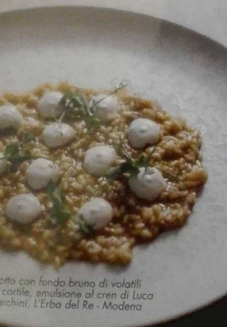
...otto con fendo bruno di volatili ...cortile, emulsione al cren di Luca ...archini, L'Erba del Re - Modena