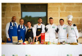
Ristogolf 2019 - Acaya Finale staff

A fine cena tutti gli chef, la brigata, il maitre e lo staff di sala vengono accolti sul palco con un caloroso applauso. Insieme a loro viene consegnato l'assegno di beneficenza alla Fondazione Cecilia Gilardi Onlus , il cui progetto è finanziare tre borse di studio nell'ambito della formazione di sala, di cucina e di pasticceria ad altrettanti meritevoli neo diplomati dell'Istituto Professionale Servizi per l'Enogastronomia e l'Ospitalità Alberghiera "Carlo Porta" di Milano.