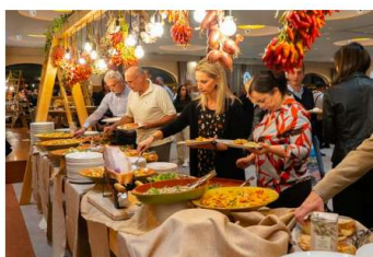
Ristogolf 2019 - Acaya Finale