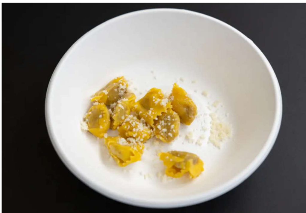
Ravioli Plin ai tre arrosti

La fine della gara è seguita da momenti di divertimento, prima delle premiazioni. Immaneabili i cocktail del Bulk Mixology food bar , poi gli interventi degli chef Thomas Papa con uno speciale risotto burro e salvia con animelle e infine lo chef Fabrizio Rebolini , ristorante Belvedere , con un piatto emblema di questo territorio, i ravioli del Plin ai 3 arrosti .