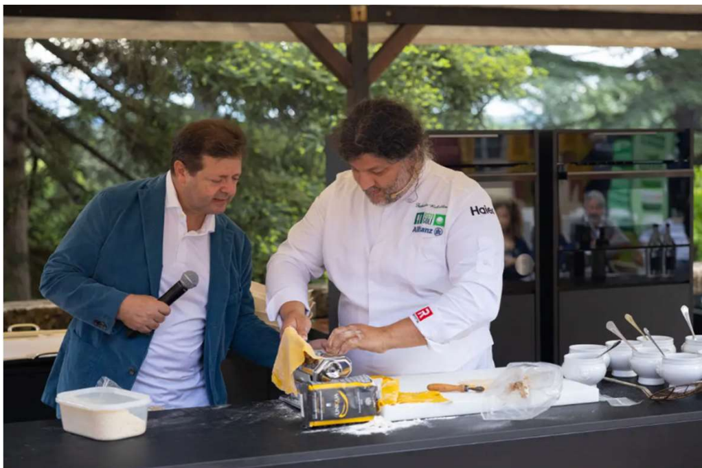
Dopo la gara, il cooking show

Sono state 15 le postazioni sul campo degli sponsor di Ristogolf 2023: tra queste Allianz, Haier, Penske Cars, Grupo Adma, CESVI, Axpo Italia, Callaway, Agnelli Since 1907. Dopo la diciottesima buca, un cooking show grazie ad Haier , main sponsor del Circuito Ristogolf 2023.