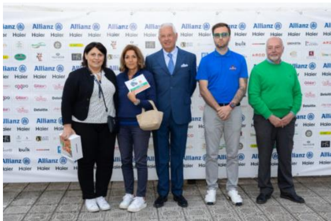
Foto di rito per l'album dei ricordi e poi tutti pronti per l'ultimo atto: il Gourmet Party a cura del ristorante Da Vittorio F.lli Cerea, per concludere la serata in bellezza. In puro stile Ristogolf ovviamente! Appuntamento alla seconda Tappa del Circuito Ristogolf 2023 by Allianz: ci vediamo il 31 maggio al Golf Club Verona .