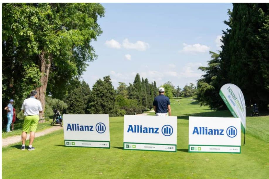
Ristogolf, terza tappa in provincia di Alessandria

Entra nel vivo il Circuito Ristogolf 2023 by Allianz. Dopo Alessandria e Verona, la terza tappa si terrà al Golf Colline del Gavi. Torniamo in provincia di Alessandria, più precisamente a Tassarolo, ma continua il divertimento all'insegna della buona cucina.