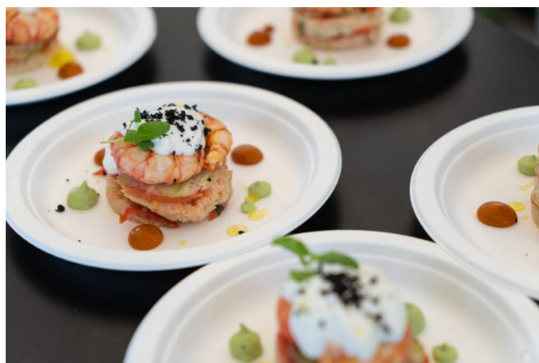
Ristogolf – piatto

Ristogolf si impegna a sostenere la Fondazione con “Gioca per Fondazione Francesca Rava NPH Italia ETS per aggiudicarti un posto al Teatro Alla Scala!”. Durante ogni tappa, i generosi Ristogolfisti che avranno effettuato una donazione in favore della Fondazione proveranno ad aggiudicarsi un posto all'esclusivo evento “Serata straordinaria Teatro Alla Scala”, l'annuale appuntamento a teatro con la Fondazione Rava. Madrina d'eccellenza per la Fondazione è l'attrice Martina Colombari.