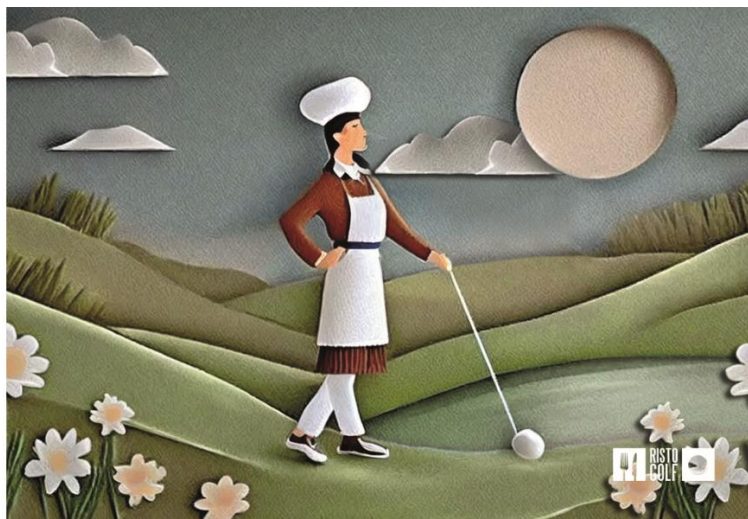
Circuito Ristogolf 2024 by Allianz 4

Tra le novità di questa edizione 2024 un tema visivo che celebra la poliedricità dell'animo Ristogolf.