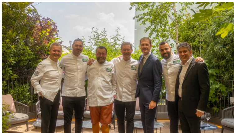
Circuito Ristogolf 2024 by Allianz Gli chef

Ristogolf ha preparato un programma ricco di sport, degustazioni d'eccellenza e momenti d'intrattenimento.