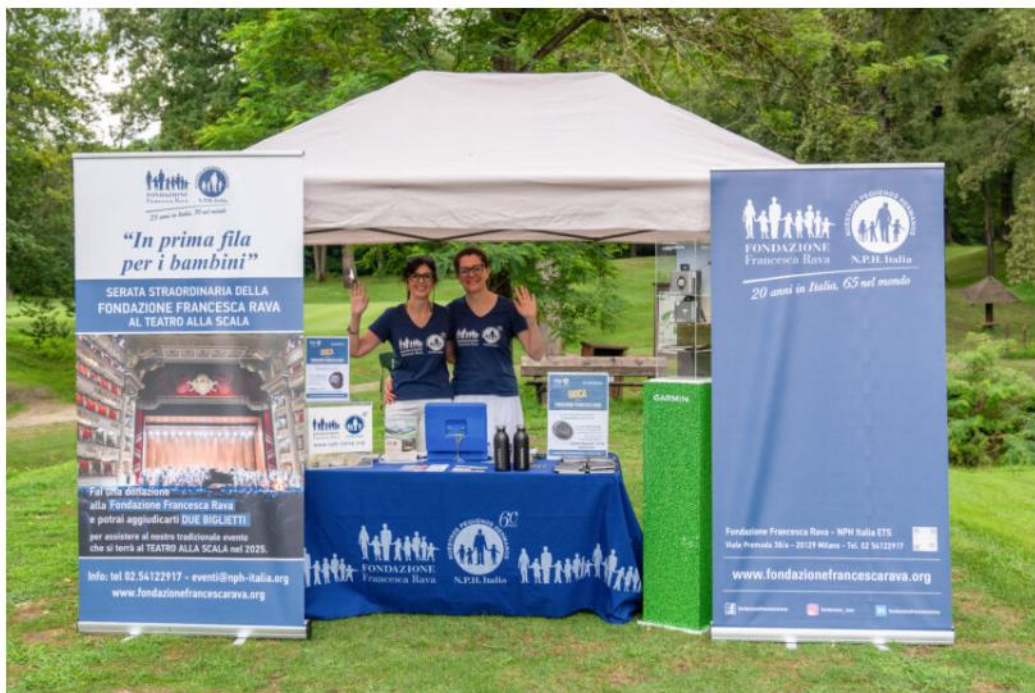
Ristogolf 2024 – postazione Fondazione Francesca Rava