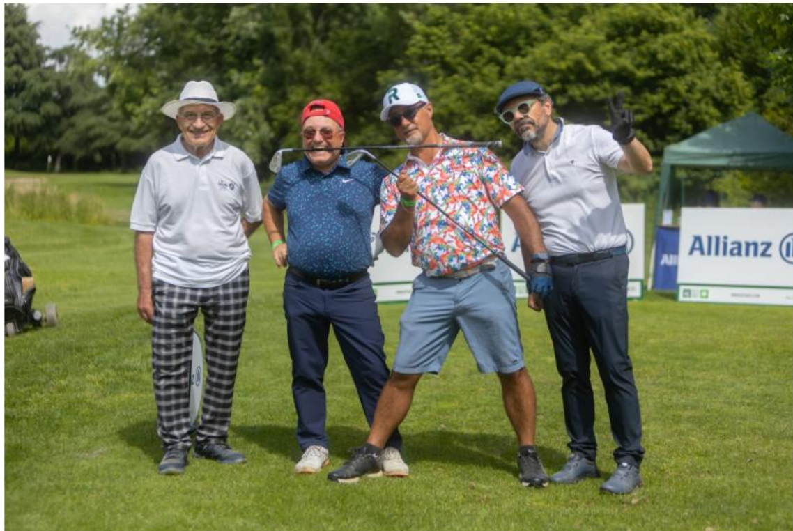
Ristogolf 2024 – giocatori in campo