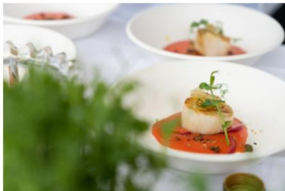
Ristogolf 2024 – piatto

Durante il weekend, il 18 ottobre , si disputerà la gara finale del Circuito sul campo dell' Adriatic Golf Club Cervia a Cervia (RA), sede l'anno scorso del 81° Open d'Italia Golf. Il Parco della Salina, i Magazzini del Sale e la Torre di San Michele, contribuiscono a creare la suggestiva atmosfera che avvolge le 27 buche del tracciato che con il Mare Adriatico e la Secolare Pineta chiudono una cornice di rara bellezza.