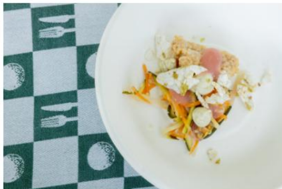
Ristogolf 2024 – piatto