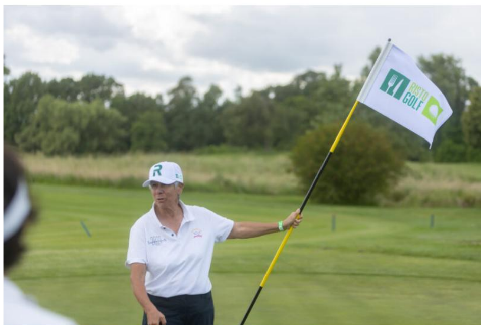
Ristogolf 2024 – giocatori in campo